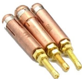
Elektrody do kołków/trzpieni